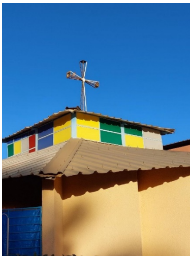
über allen Dächern ist Ruh'...: Ouaga-Stadtzentrum, mitten unter'm Putsch, Montag Früh