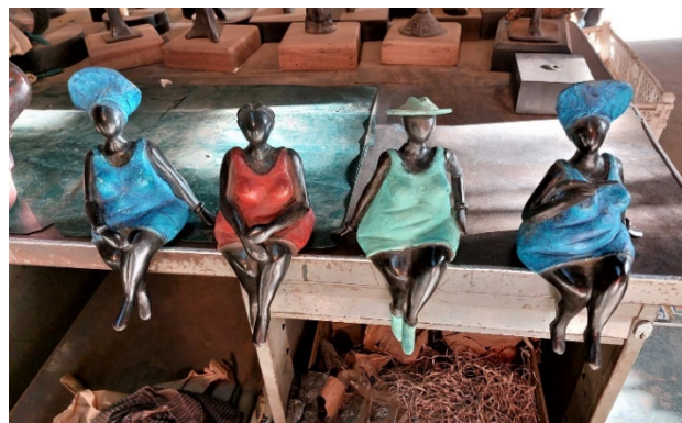
Kunsthandwerk. Der Verkauf leidet am Terrorismus und dem Ausbleiben der TouristInnen, nicht am Putsch.

Viele fragen sich, warum sie einer Demokratie nachweinen sollen, die es Blaise Compaoré über Jahrzehnte ermöglicht hat, an der Macht zu bleiben; einem auf Wahlen beruhenden demokratischen System, das nach einer kurzen wahl-losen Übergangszeit (die auf Druck der “internationalen Gemeinschaft“ auf ein Jahr begrenzt worden war), in der mehr vorwärts ging als in langen Jahren davor und auch in den sieben Jahren seither; einer Demokratie, die nichts geleistet hat, als einen erwiesenermaßen unfähigen Präsidenten im Amt zu bestätigen – weil seine Partei mehr Geld hatte und hat als andere, weil sein Parteiapparat effizienter war, weil die zur Verfügung stehenden Alternativen um nichts besser waren.