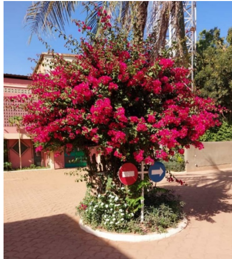
Bougainvilleen im Lorette-Hotel-Hof

Das einfache aber überaus angenehme Hotel Lorette befindet sich im Stadtzentrum, ein paar hundert Meter von der nächsten Kaserne entfernt. In der Nacht waren dort immer wieder Schüsse gut zu hören. Die geplanten Treffen konnten aber alle plangemäß stattfinden. Erwin & Co vertrauten ihren burkinischen PartnerInnen, die ihnen versicherten, dass keinerlei Gefahr bestand.