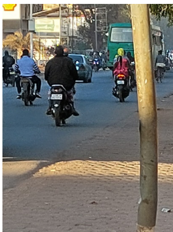
Mitten unter'm Staatsstreich, Stadtzentrum Montag Früh 24.1.2022

Damit ich nichts Falsches sage: Seit kurzem macht uns Covid sehr wohl Sorgen – bei den in Kamerun derzeit abgehaltenen Fußball-Afrikameisterschaften werden die Spieler regelmäßig getestet. Gerüchtemäßig werden vor allem die stärksten unter den Gegnern der Hausherren positiv getestet – das war jedenfalls bei Burkina der Fall, das im Eröffnungsspiel gegen Kamerun dann tatsächlich den Kürzeren zog (die Gruppenphase aber trotzdem überstand und nach dem 7:6-Achtelfinalsieg im Elferschießen gegen Gabun nun am Samstag gegen Tunesien im Viertelfinale antritt).