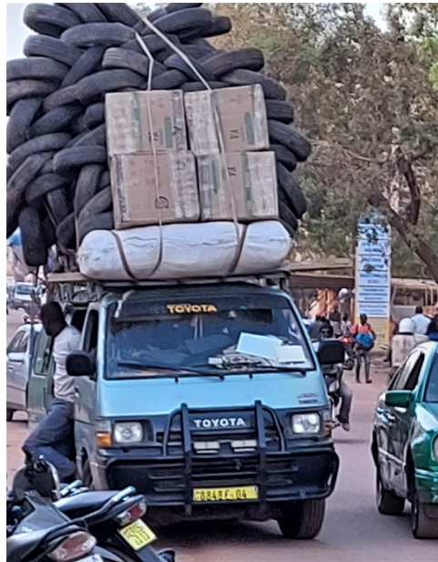
Am Tag nach dem Putsch im Stadtzentrum