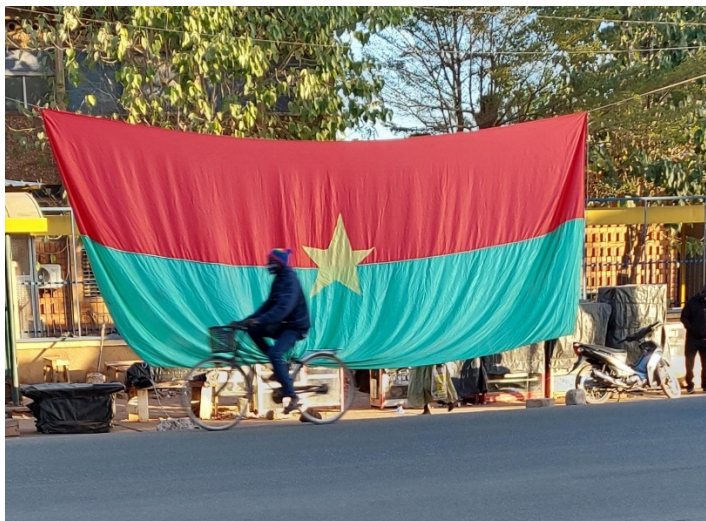
Montag Früh, 24.1.2022, mitten unter'm Staatsstreich, im Stadtzentrum der burkinischen Hauptstadt 1