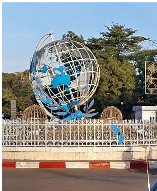
Der Platz der Vereinten Nationen (Rond-point des Nations Unies) im Stadtzentrum am Tag nach dem Putsch

Die Internationale Staatengemeinschaft hat freilich schon begonnen, Druck auszuüben. Allerschnellstmöglich gälte es, die verfassungsmäßige Ordnung wiederherzustellen. Wo kämen wir denn sonst hin.